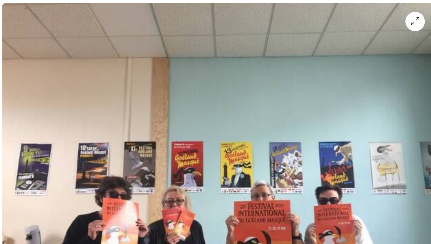
Les organisateurs du Goéland masqué proposent leurs coups de cœur à quelques jours de la nouvelle édition du festival international du polar de Penmarc'h. | OUEST-FRANCE

Depuis plus de 20 ans, des bénévoles passionnés de polar font vivre le Goéland masqué à Penmarc'h (Finistère). La prochaine édition se déroulera du 27 au 29 mai 2023. En amont, les organisateurs dévoilent leurs livres coups de cœur.